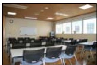
ミーティングルーム風景