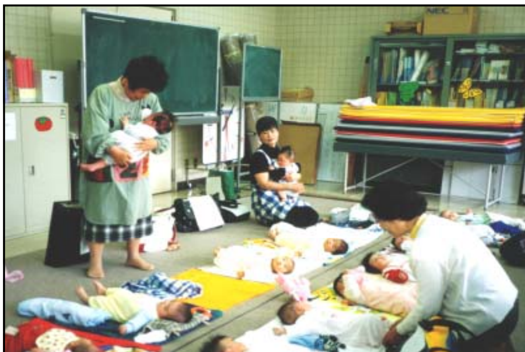
子育て支援活動の様子