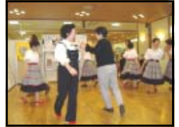
楽しいフォークダンス